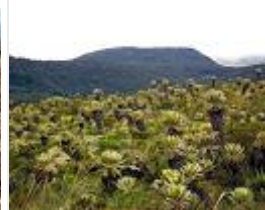
Parque Nacional Natural de Puracé