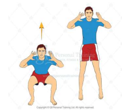
Salto hacia adelante y atrás(10rep)