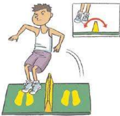
Salto laterales (10rep)