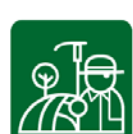
Asuntos Agrarios y Tierras